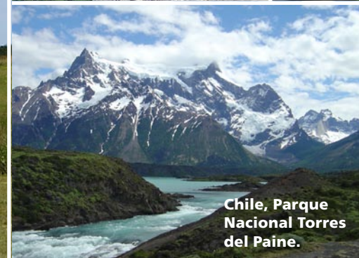
Chile, Parque Nacional Torres del Paine.