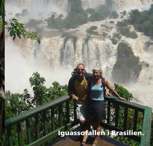
Iguassofallen i Brasilien.