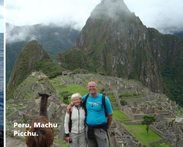
Peru, Machu Picchu.