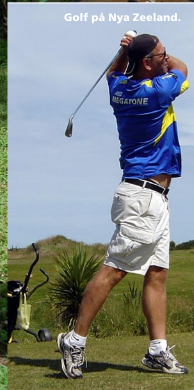
Golf på Nya Zeeland.