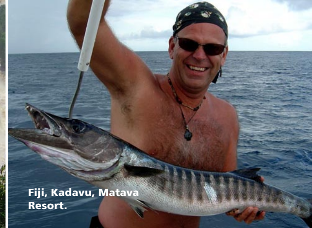
Fiji, Kadavu, Matava Resort.